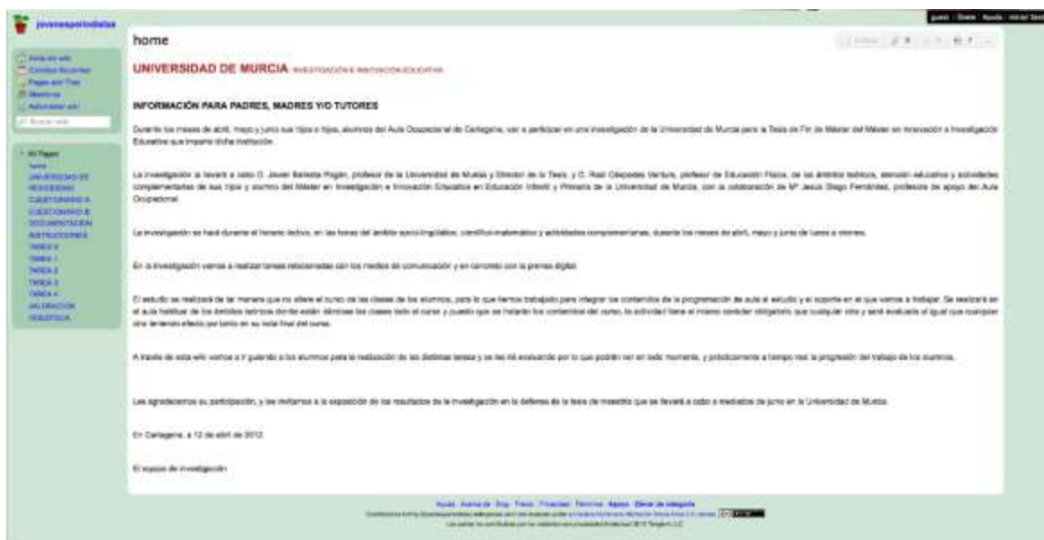
Figura 2. Captura de la página de bienvenida de la wiki

Además de estos apartados, nosotros incluimos los que consideramos necesarios para poder llevar a cabo nuestra experiencia. Tenemos un apartado en el que se agrupan los artículos que los alumnos generan en las tareas, el pre-test y el post-test que hemos pasado para recoger datos para luego analizar e interpretar en busca de posibles cambios tras la experiencia en la wiki, un apartado de documentación en el que los alumnos van a crear su propio libro de texto con el que fundamentar su trabajo, las cinco tareas que se le asignaron a lo largo del trimestre, un apartado donde están publicados los resultados y registro de actividad de los alumnos, y por último un banco de vídeos seleccionados según su idoneidad para las tareas. A continuación procedemos a explicar de manera más detallada cada uno de los apartados.