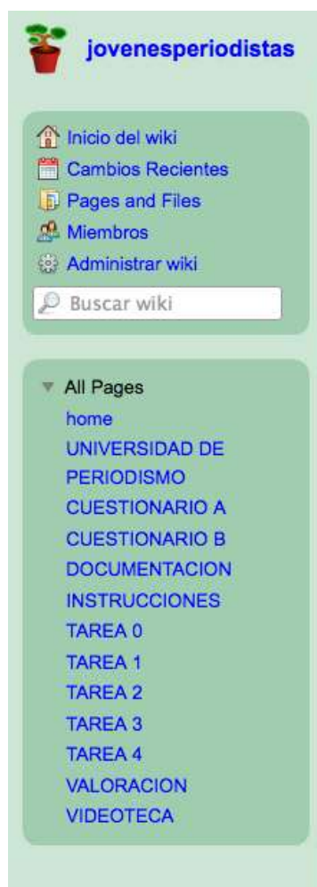
Figura 3. Detalle del menú de la wiki

En esta fase, además de preguntar también por nombre, apellidos y fecha de realización con el fin de poder relacionar las respuestas con los participantes, les preguntamos de manera abierta por todo lo que han aprendido sobre los grupos mediáticos, y en general sobre todo lo que han aprendido durante la actividad. Les pedimos que marquen los géneros periodísticos que hemos trabajado y que nos indiquen cuál sería el más apropiado para cubrir una información determinada. Además, incluimos unas preguntas sobre dos de las tareas que han realizado con el fin de comprobar qué han aprendido en éstas. Les planteamos como parte de la última tarea de la experiencia y en parte como evaluación final de los contenidos que les hemos enseñado. A nosotros también nos sirve como prueba para detectar cambios que se hayan podido dar a lo largo de la experiencia en Jóvenes Periodistas.